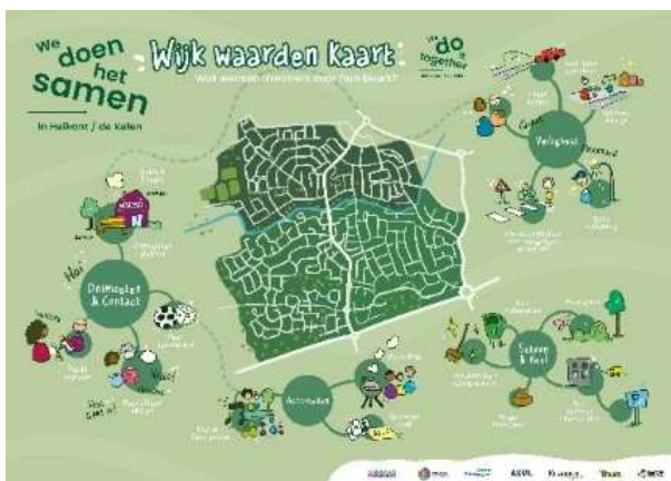
Afbeelding 5 Wijk waarden kaart van Heikant De Kelen