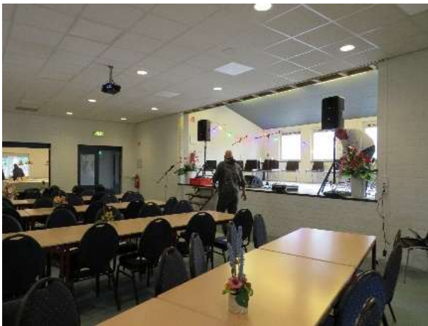
Afbeelding 1 Wijkgebouw De Erikant met glazen deuren en open podium