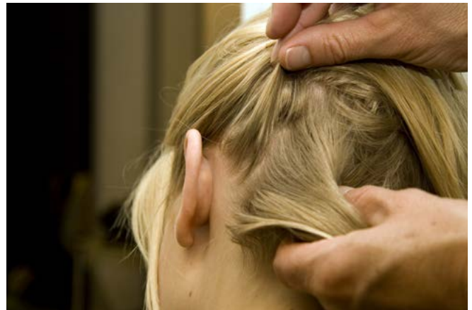
Als u op hoofdluis controleert, kijk dan goed tussen de haren.