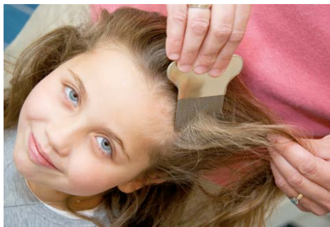
De uitkambehandeling is de meest natuurlijke aanpak tegen hooftluis.

Let op: een kind dat behandeld is met een middel waar malathion in zit, mag op de dag van de behandeling niet zwemmen. Dit omdat chloor de werking van malathion tegengaat. Vraag eventueel advies aan apotheek of drogist.