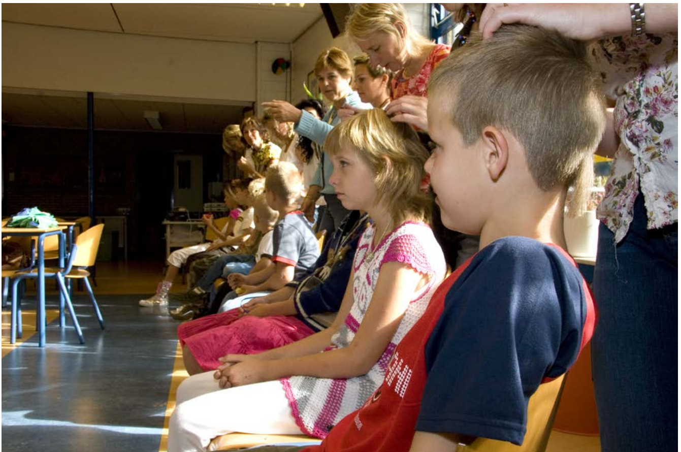
Een ouderwerkgroep kan op school de kinderen regelmatig controleren.