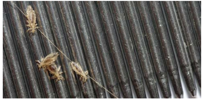
Hoofdluizen op een kam.

Kinderen tussen de 3 en de 12 jaar krijgen vaker hoofdluis omdat ze tijdens het spelen vaak letterlijk de hoofden bij elkaar houden.