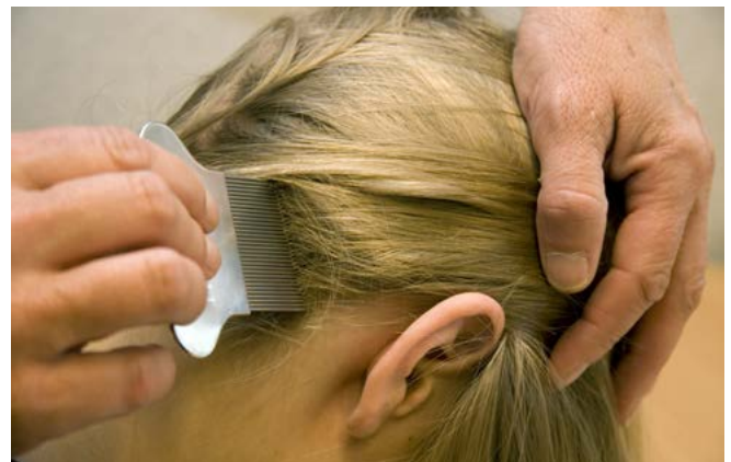
Kam het haar met een fijntandige kam boven een wit papier of de wasbak.